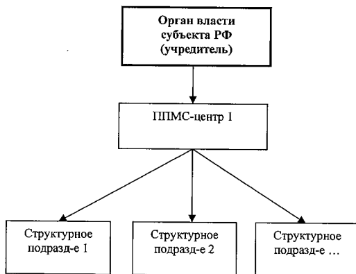
Рис.2. Схема централизованной модели организации деятельности ППМС-центров

В регионе уполномоченным органом власти создается Центр с филиалами, которые распределяются в соответствии со спецификой территориального расположения, численностью детского населения и его потребностью в помощи. Центр представляет собой жесткую иерархическую систему оказания психолого-педагогической, медицинской и социальной помощи. Такая структура позволяет обеспечить высокую централизацию управления, единый стандарт услуг, рациональное использование кадровых и финансовых ресурсов, прозрачность и достоверность результатов деятельности.